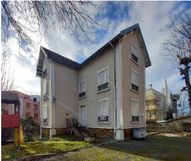
Bâtiment A (centre de soins)