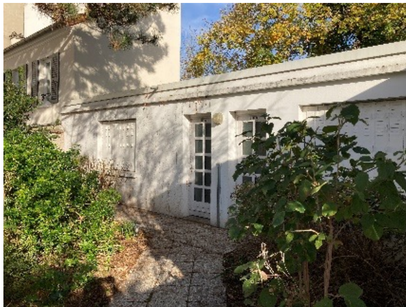
Bâtiment B: dépendance