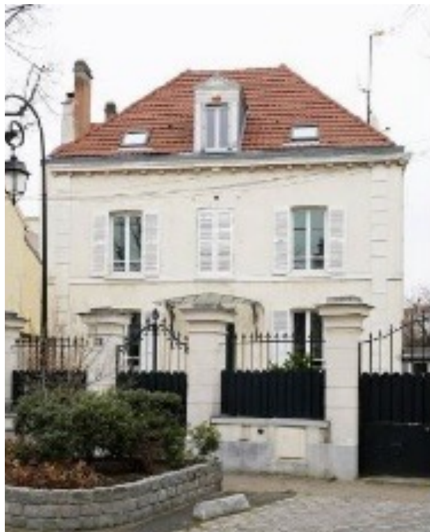
Bâtiment A : pavillon