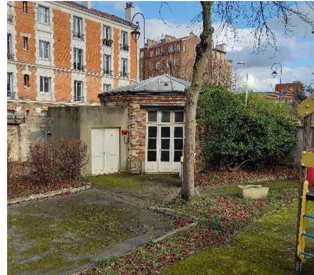
Bâtiment B (Rotonde, centre de soins)