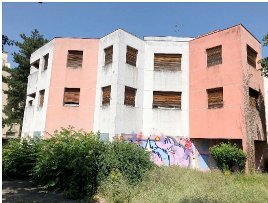
Bâtiment C : démolition préalable