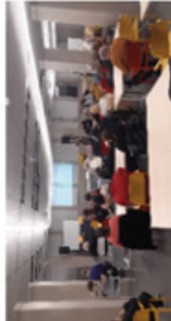
Point démolition de la passerelle