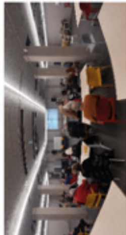
Point travaux du secteur