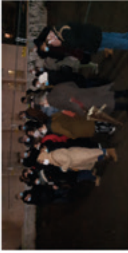
3 - Point foyé Maurice Ravel