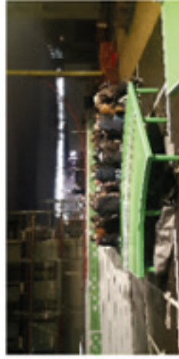
4 - Présentation du terrain d'évolution "Fraternité"