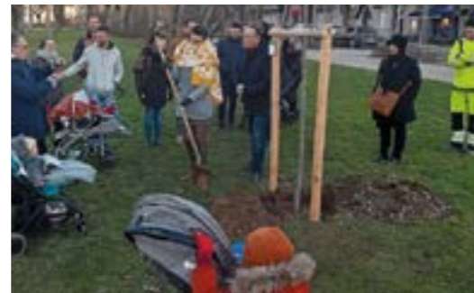
A Rodez, quelques parents ont bravé le froid pour assister à la plantation symbolique d'un chêne dans le jardin public.

Rodez : Si un enfant est né entre le 1 er novembre 2021 et le 31 octobre 2022, alors les parents peuvent choisir de parrainer un arbre . Celui-ci sera planté soit dans un espace vert, soit dans la propriété des parents. Et ainsi, l'arbre grandira en même temps que le nouveau-né. Un bracelet au nom de l'enfant sera posé sur son tuteur.