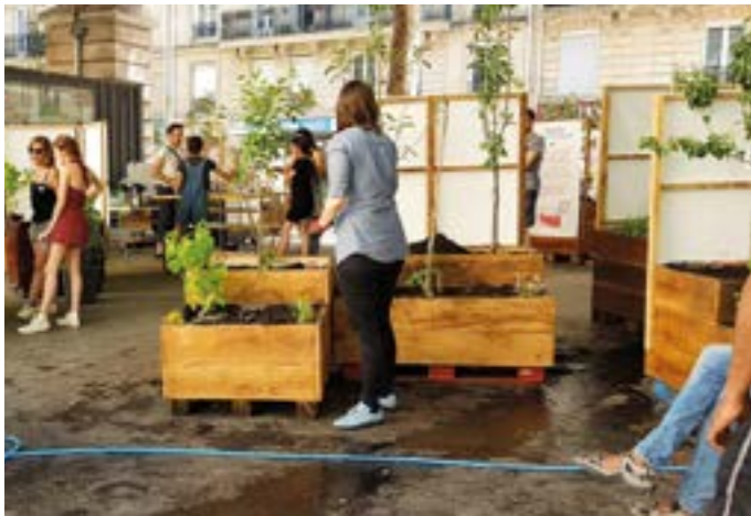
Inauguration d'un site suite à un chantier, le 29 juin 2019.

L'association Vergers Urbains propose des chantiers participatifs de plantation pouvant s'adresser à des scolaires comme à des bénévoles, dans des écoles, sur des terrains communaux mais aussi dans des résidences.