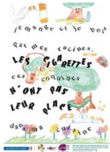
Panneau réalisé par les enfants du quartier avec les associations Plante & Planète et Mom» Freney

Dans une école du 12 ème arrondissement de Paris, les enfants participent à la réalisation d'une campagne de sensibilisation diffusée par la mairie.