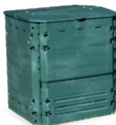
Composteur plastique 400 l