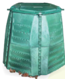
Composteur plastique 600 l