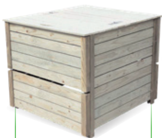
Composteur bois 400 l