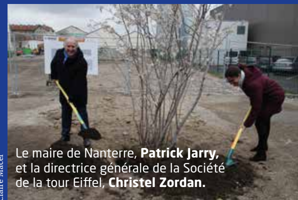
Le maire de Nanterre, Patrick Jarry, et la directrice générale de la Société de la tour Eiffel, Christel Zordan.

Le 6 avril, la Société de la tour Eiffel et la ville de Nanterre ont planté le premier arbre du futur, à l'occasion du lancement du chantier de Nanturra (25, rue des Hautes-Pâtures). Ce nouveau bâtiment de 5 400 m 2 pourra accueillir une grande variété de locataires (activités industrielles, logistique, tertiaire). Livraison prévue mi 2024.