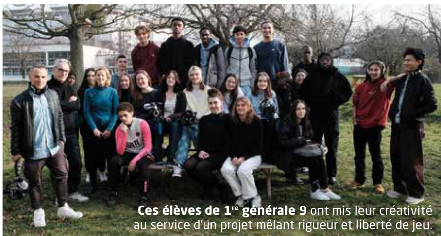
Ces élèves de 1 re générale 9 ont mis leur créativité au service d'un projet mêlant rigueur et liberté de jeu.

📍 Campus film festival : du 12 au 14 mai au cinéma Saint-André des arts (30, rue Saint-André-des-Arts, Paris 6 e ). Projection gratuite des courts métrages et remise des prix le vendredi 12 mai à 19h (salle n° 3, entrée par le 12, rue Git-le-Cœur).