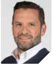
GROUPE NANTERRE ENSEMBLE