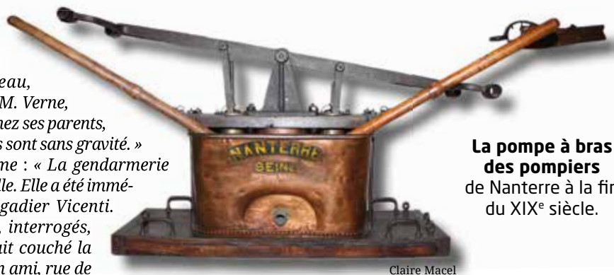
La pompe à bras des pompiers de Nanterre à la fin du XIX e siècle.