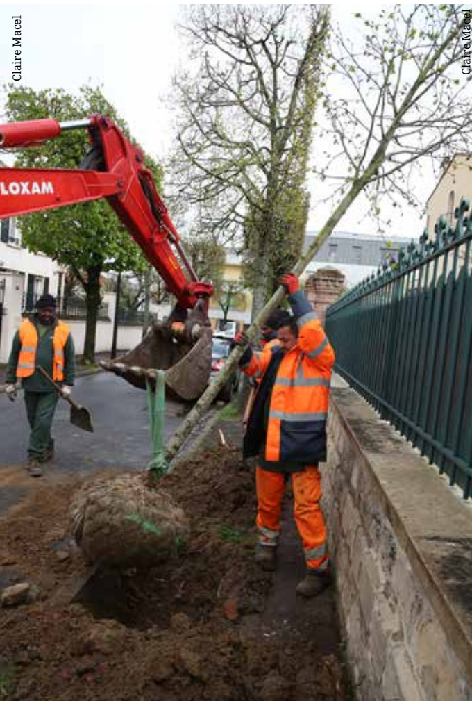
Avenue Rochegude, dans le centre-ville.

Il favorise le rafraîchissement de l'atmosphère, l'infiltration de l'eau et la biodiversité, absorbe le carbone et améliore la qualité de vie : l'arbre en ville présente de multiples vertus allant dans le sens de la transition écologique, et c'est pour cette raison que l'équipe municipale s'est engagée à en planter 5 000 sur tout le territoire au cours de son mandat. Cette volonté doit cependant composer avec toutes sortes de contraintes, comme la présence de réseaux souterrains, l'étréouissement des rues ou des projets de construction. Fin mars 2023, la ville et ses partenaires (Paris La Défense, la Semna et le conseil départemental) avaient planté 1 137 arbres et en avaient abattu 486 autres en mauvais état sanitaire, en fin de vie ou dangereux. Un chiffre encore sous-estimé puisqu'il ne comprend pas la totalité des plantations effectuées. Ainsi, le campus Arboretum apportera dans les prochains mois entre 600 et 1 000 arbres supplémentaires. Les membres du conseil citoyen de la transition écologique (CCTE) suivent de très près l'avancement du Plan 5 000 arbres. Réunis le 22 avril, ils ont exploré plusieurs pistes pour que ce vaste programme soit aussi l'affaire des habitants : consultation sur le choix des emplacements, organisation de plantations participatives, incitation auprès des entreprises et des bailleurs pour planter davantage... Une ambition collective dans l'intérêt de tous !