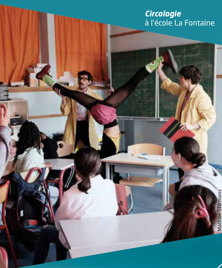
Circologie à l'école La Fontaine