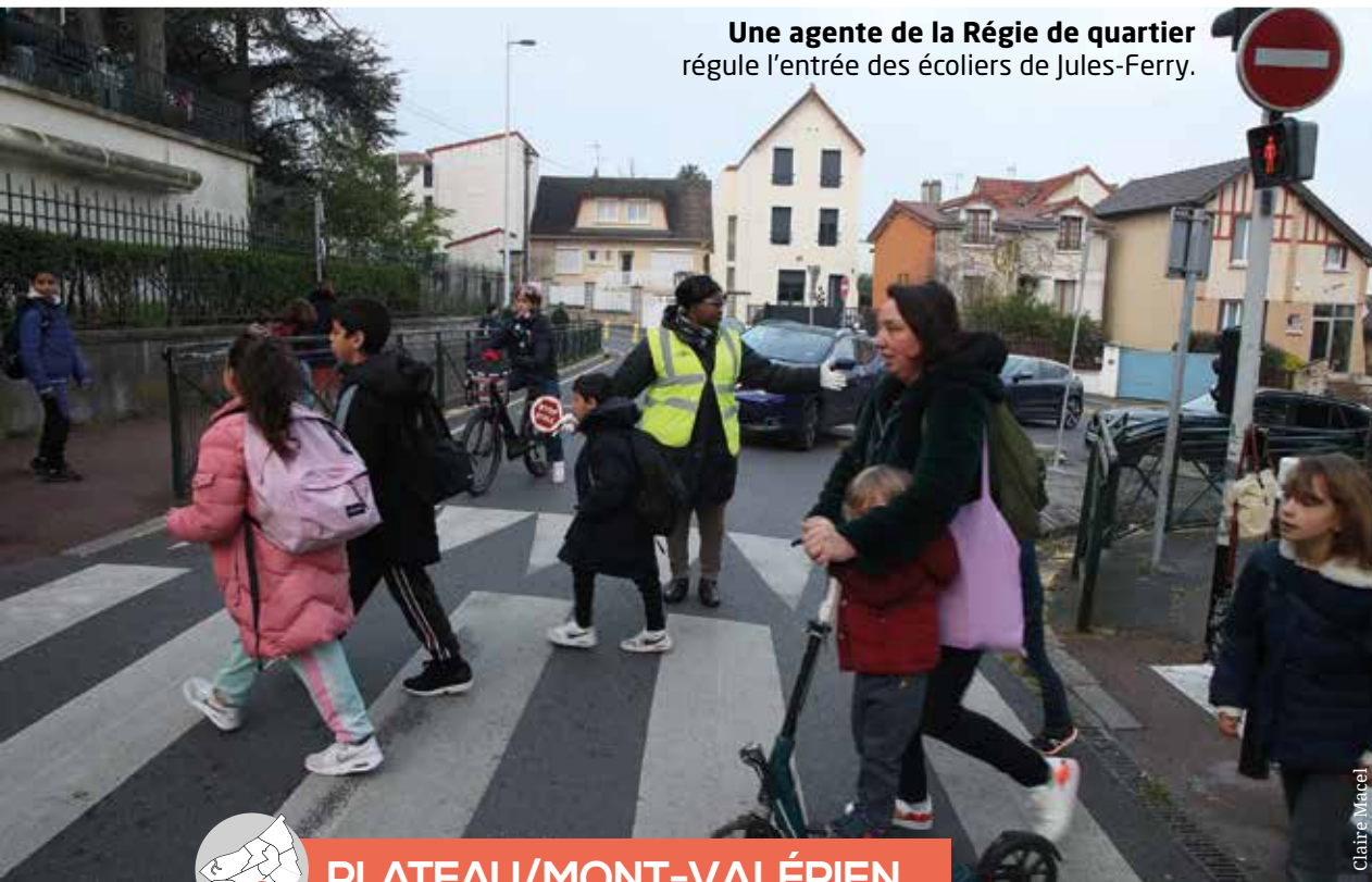
Une agente de la Régie de quartier régule l'entrée des écoliers de Jules-Ferry.