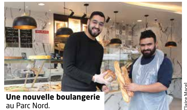
Une nouvelle boulangerie au Parc Nord.