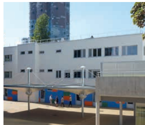
Groupe scolaire Maxime-Gorki, avec les bâtiments neufs et les travaux dans la cour extérieure

qui s'engage va aussi concerner la cour qui va être généreusement végétalisée sur 1 000 m 2 , 12 des 17 arbres existants seront conservés et 29 autres plantés. Un préau va être installé ainsi que des jeux pour favoriser l'éducation à l'environnement et la mixité entre les enfants. Une grande partie de la cour restera néanmoins accessible.