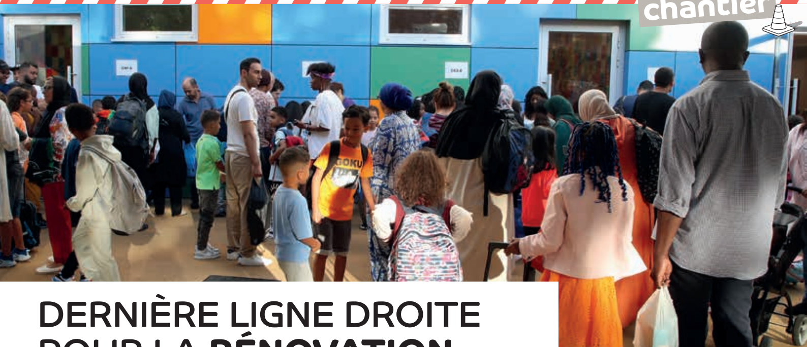
Rentrée des classes dans l'école Maxime-Gorki