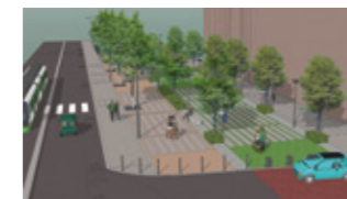
Une partie de l'avenue de la République sera aménagée pour accueillir les nouvelles constructions et le tramway.

Situé à l'emplacement actuel de la rue des Pâquerettes, le long des nouvelles constructions, jusqu'à la limite communale de Colombes, le mail servira aux piétons et au stationnement des vélos. Largeur : 20 mètres.