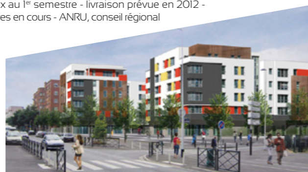
Vue depuis l'avenue de la République

À noter : Les logements sociaux neufs sont destinés en priorité aux personnes dont le logement est démolé dans le cadre du PRUS.