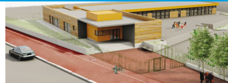
Ecole La Fontaine

Après un report de 3 mois, les travaux de l'école La Fontaine ont commencé. Livraison prévue pour la rentrée scolaire de 2012.