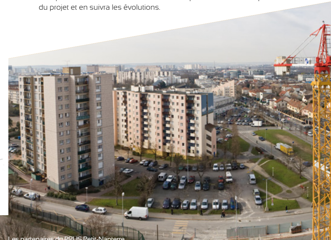
Les partenaires du PRUS Petit-Nanterre

Chaque numéro fournira les éléments indispensables à la compréhension du projet et en suivra les évolutions.