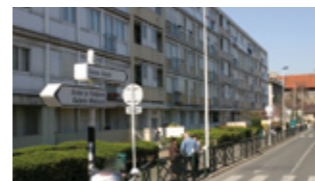
Dans la rue, la circulation sera limitée à 30 km/h.

Sont prévus la réfection et l'élargissement des trottoirs, le remplacement du mobilier d'éclairage, la création de 15 places de stationnement longitudinal et des plantations.